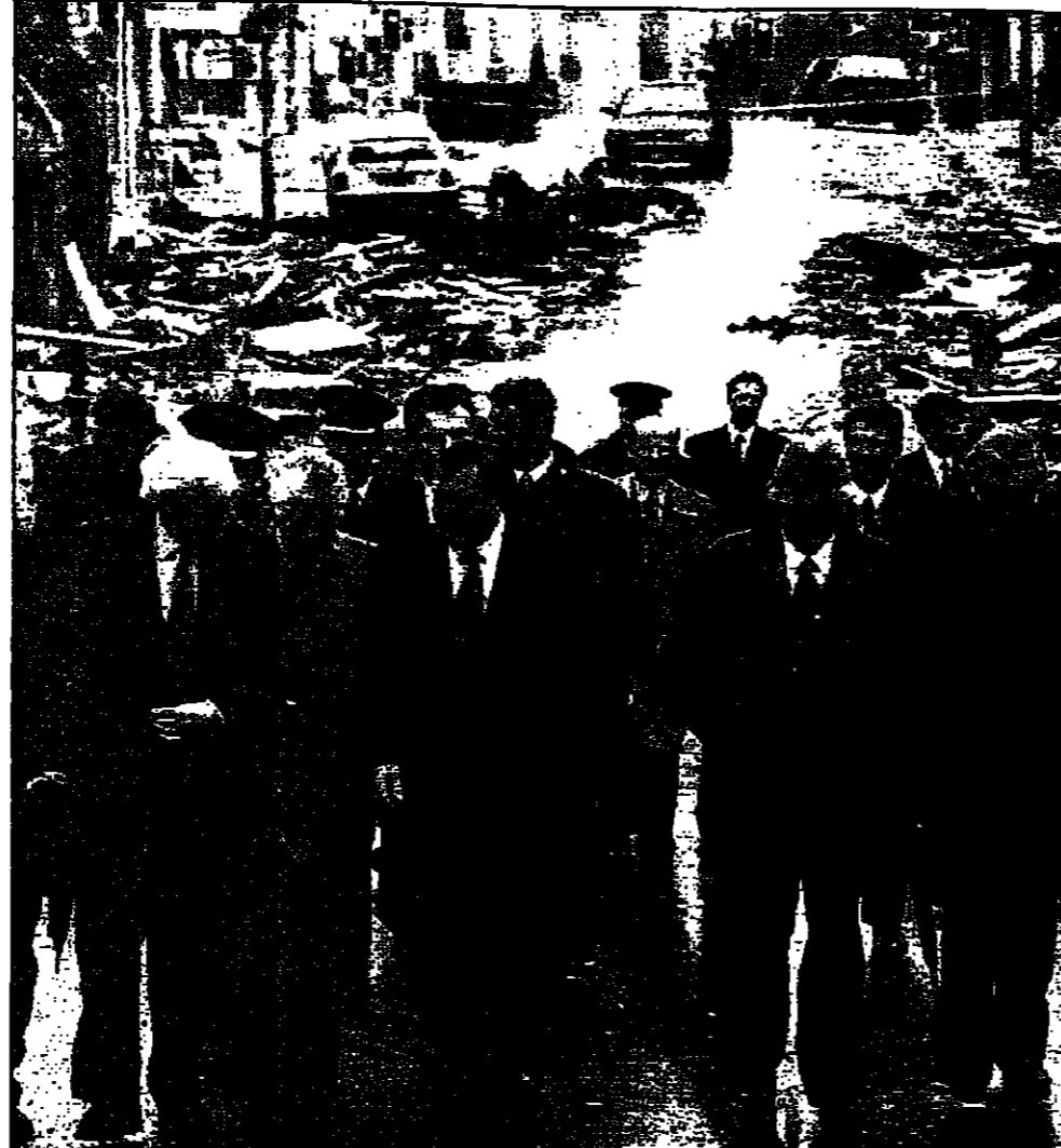
نائب رئيس الوزراء البريطاني جون بيرسكن (يسار) يتفقد موقع انفجار سيارة مفخخة السبت في اوماه بإيرلندا الشمالية